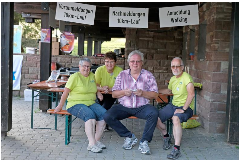
Helfer vor dem großen Ansturm