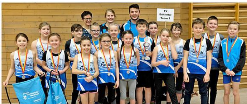
Team 1 & 2 U12